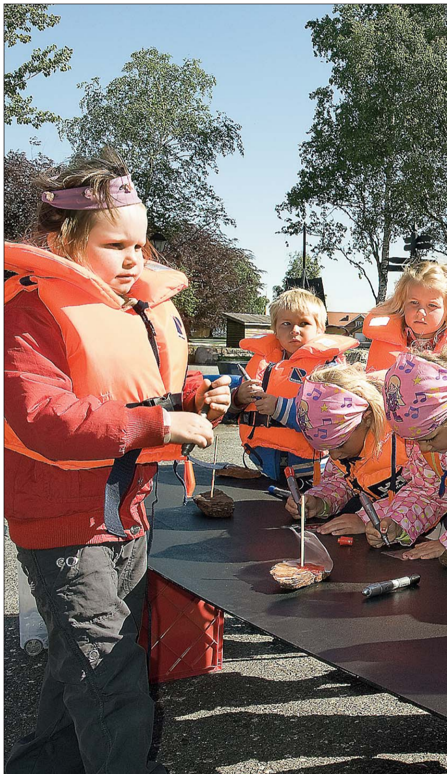
Tid for mast: Alle fikk en mast i barkebåten, på rad og rekke.