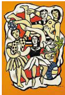
Leger, fra utstillingen THE ART OF TOMORROW TODAY, Henie Onstad-samlingen