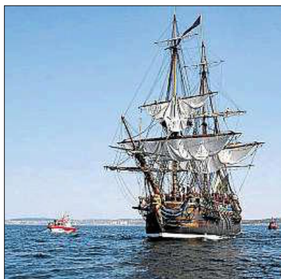
Skipet er en kopi av den opprinnelige ostindiafareren «Götheborg» som gikk på grunn og forliste ved innløpet til Göteborg 12. september 1745.