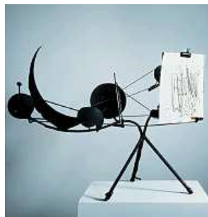
Tinguely, Méta Matic No 10

I sommer presenteres modernismen som den aldri har vært gjort tidligere i Norge. Bli kjent med Tinguelys bevegelige maskiner, Jan Groths univers i svart og hvitt og se høydepunkter fra Henie Onstad-samlingen. I tillegg kan Høvikodden by på egen badestrand, flotte turområder, barneverksted hver søndag, brasserie Bølgen & Moi og eksklusiv museumsbutikk.